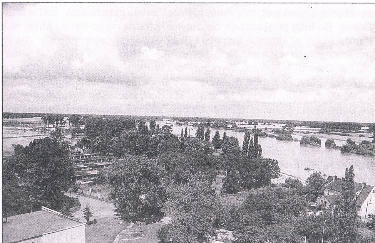
Zdj. nr 6. Peryferia Oławy. Kolejna wielka fala na Odrze w niewytłumaczalny sposób ominęła to miasto zalewając kilka kilometrów dalej tysiące hektarów ziemi. Kilkanaście wiosek i miasteczek znalazło się pod wodą

Tych spełnionych z powodu braku modlitwy i pokuty prorocत्व, nie mógł bez pomocy Bożej przewidzieć żaden człowiek. Dowodzą one niezbitcie o nadprzyrodzo-